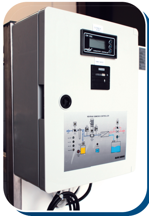
COFFRET DE COMMANDE